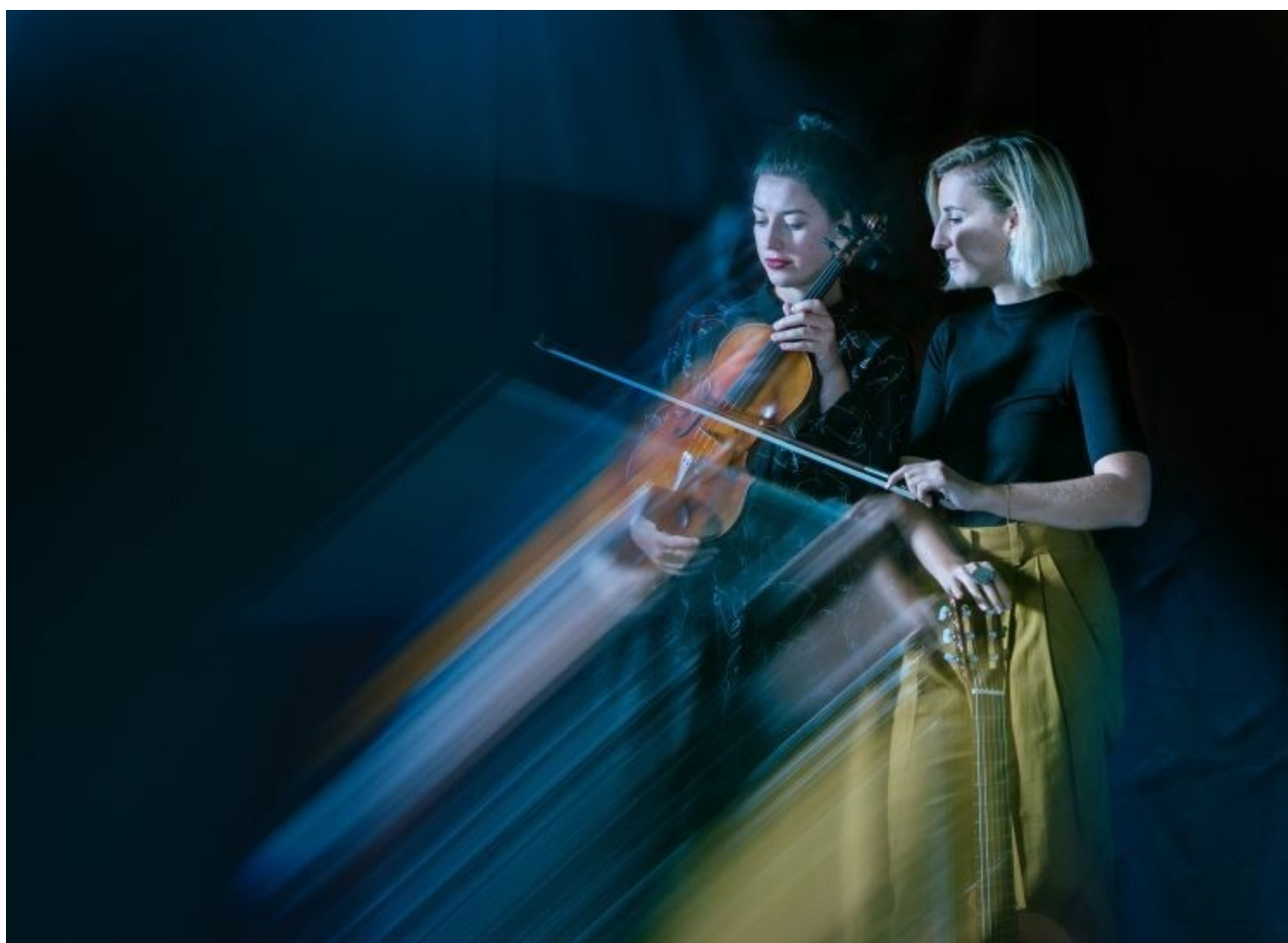
Duo Sonoma

From Carinthia comes the equally formidable and unorthodox Duo Sonoma, which surprised us all in 2021 with its CD debut "I" ("One"). The content: stylistically unbounded, expressive-imaginative sound thoughts of violin and guitar, compositionally clear and deliberately set, charging every note with meaning, while rich in original ideas.